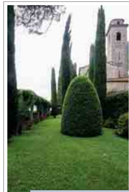
Uno scorcio di Villa Fogazzaro