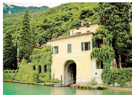
Villa Fogazzaro a Oria Valsolda

UN RECITAL teatrale con degustazione condotto dall'attore Luca Radaelli e dal gourmet Mauro Rossetto, "Il gusto delle parole", dà il via questa sera alle 21 al Lido di Cadenabbia, sul lago di Como, alla IV edizione del Festival Premio Antonio Fogazzaro che coincide quest'anno con il centenario della morte dello scrittore. Letture da Parini, Porta, Manzoni, Fogazzaro, Tessa, Gadda e Alda Merini si accompagnano ai vini doc delle terre lariane. Terre amate e frequentate da Fogazzaro, nativo di Vicenza ma legato alla villa materna di Oria Valsolda sul lago di Porlezza, lembo italiano del lago di Lugano, dove ambientò in gran parte il capolavoro del 1895 Piccolo mondo antico .